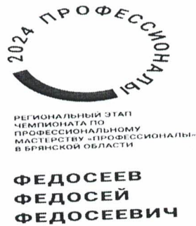
Шаблон бейдж эксперт